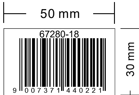
67280-18 外箱EAN-13条码标 (白底黑字)